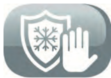
Fonction hors gel