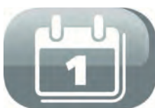
Programmation sur 24h