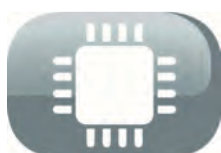
Technologie Fuzzy Logic