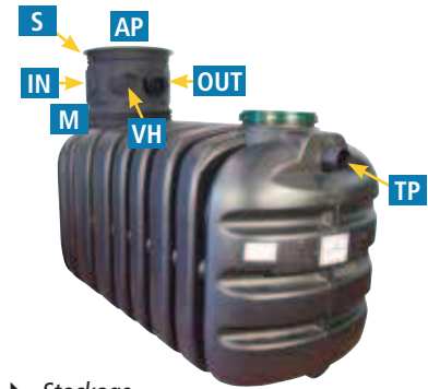
► Stockage enterré R PANIER de 2500 et 3500 l.