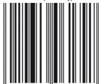
4426 Adaptateur type 513