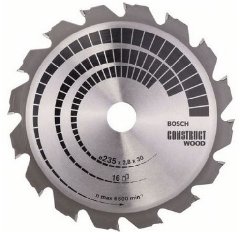
Image du produit, non emballé