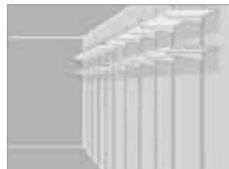
L'avantage de ce système : les étagères sont repositionnables.

Appliquer une première crémaillère contre la cloison sans la coller contre le mur latéral. Laisser une dizaine de centimètres de battement pour pouvoir visser. Vérifier sa verticalité à l'aide d'un niveau puis marquer l'emplacement des vis de fixation avec un crayon.