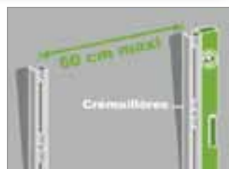
Bien vérifier l'aplomb avant de percer et visser.

Marquer ensuite l'emplacement de la seconde crémaillère, à 60 cm maximum de la première, puis de la troisième et ainsi de suite. Tracer la verticale puis continuer en procédant comme pour la première crémaillère. Afin d'avoir des étagères parfaitement horizontales, utiliser un niveau puis reporter les trous des vis sur les crémaillères suivantes.