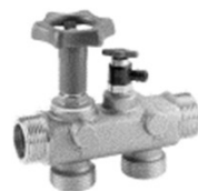
Bypass ¾" (12)