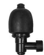
Nasadka gumowa do muszli klozetowej