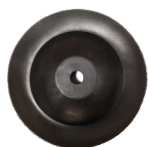
Nasadka do zlewozmywaków