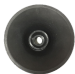
Nasadka dwustronna do rór, syfonów, umywalk odwodnień