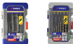
6 mèches bois plates Ø 14 à 24mm