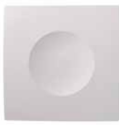
INEA vue de face