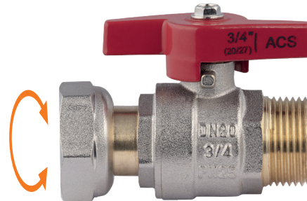
MODÈLE MF ÉCROU LIBRE