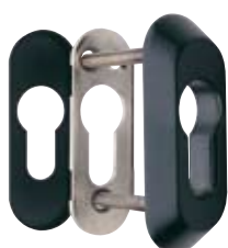
Detalle del escudo E210