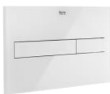
PL7 DUAL (ONE) - Placa de accionamiento con descarga dual con acabados cristal