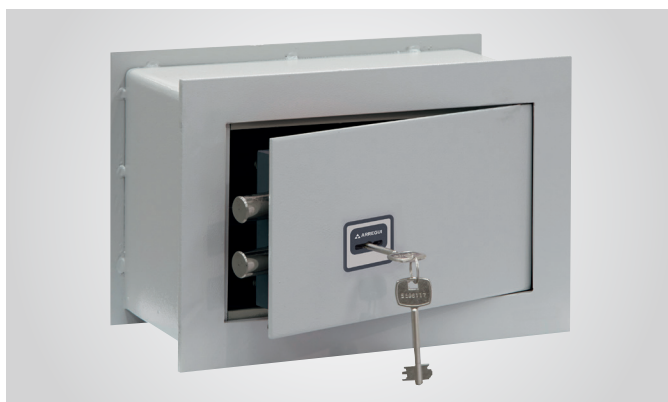
Dos bulones a distintas alturas aseguran la puerta.