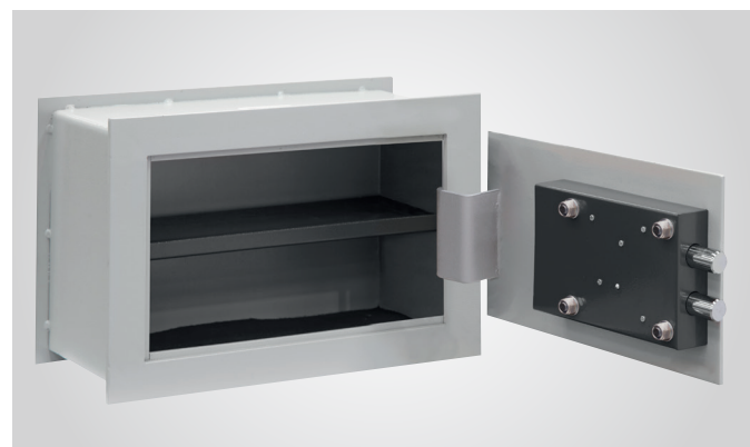
Dispone de bandeja interior.