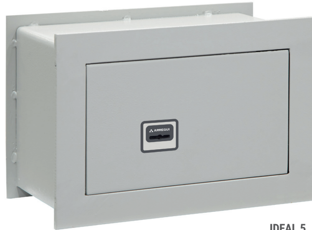
IDEAL 5 Ref. 271310