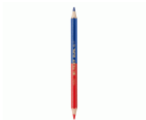
Lápiz Bicolor MEDID azul y rojo