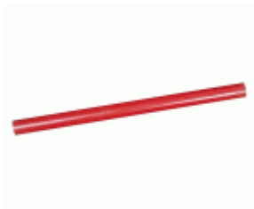
Lápiz carpintero MEDID