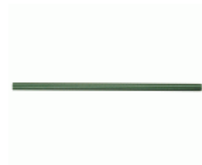
Lápiz MEDID superficies mojadas 180 mm