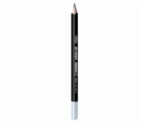
Lápiz de grafito triangular MEDID Mina HB2. Caja 12 unidades