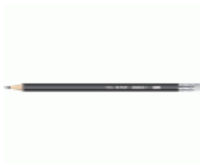
Lápiz de grafito hexagonal con goma MEDID Mina HB2. Caja 12 unidades