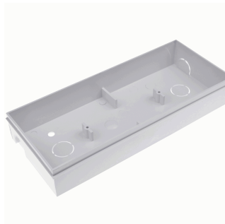
ACC. SEMIEMP. DIANA FLAT BLANCO PARED