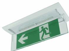
ACC. BANDE. EMP. DIANA FLAT BLANCO TECHO