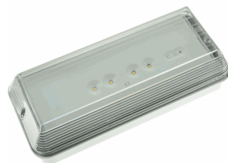
ACC. ENVOL. IP65 DIANA FLAT BLANCO