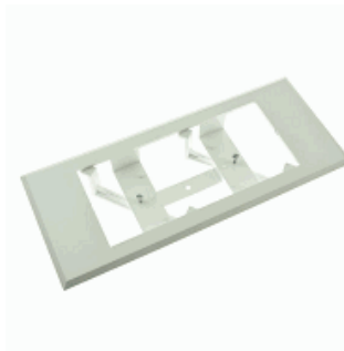
ACC. MARCO EMP. DIANA/XENA BLANCO UNIVERSAL