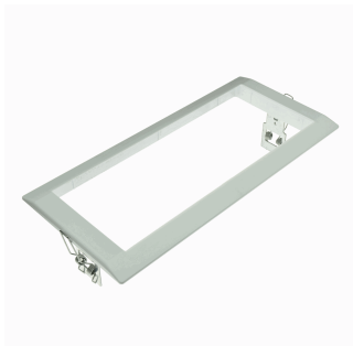
ACC. EMP. DIANA FLAT BLANCO TECHO