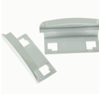
ACC. PROT. IK10 FLAT BLANCO