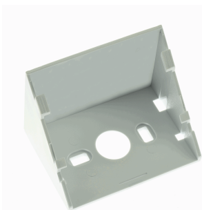
ACC. INCLINACION 47° FLAT BLANCO