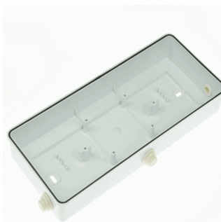
ACC. CAJA IP44 DIANA FLAT BLANCA