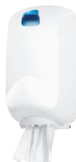
DT0402F ABS blanco Ø máx. 15 cm