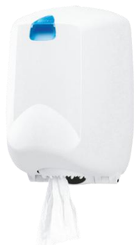
DT0401F ABS blanco Ø máx. 20,5 cm