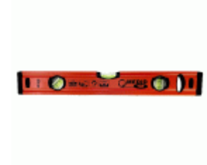
Nivel MEDID tubular PRO magnético