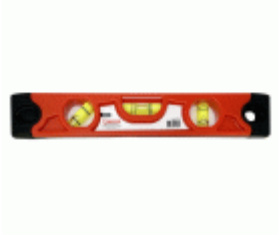
Nivel MEDID torpedo ABS