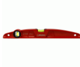
Nivel MEDID ala de avión magnético