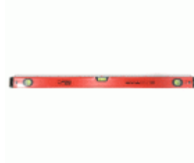
Nivel MEDID tubular con regla