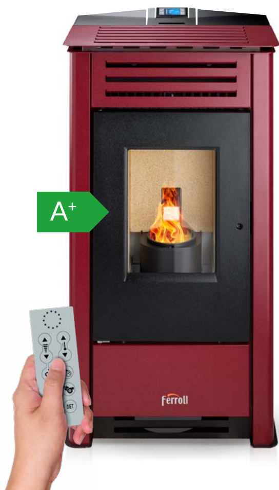
Mando a distancia incluido

Estufa de pellets modulante en acero de 10,41 kW