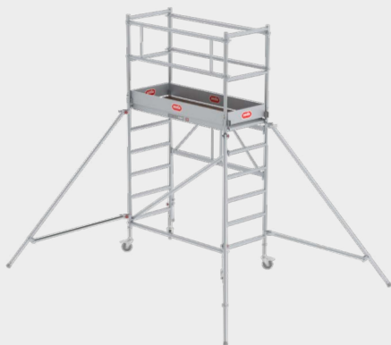
Módulo 1 + 2