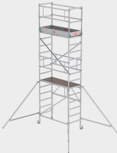
Módulo 1 + 2 + 3