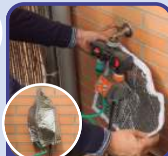
Controladores de riego