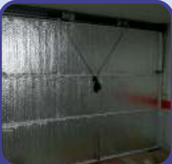
Puertas de garaje