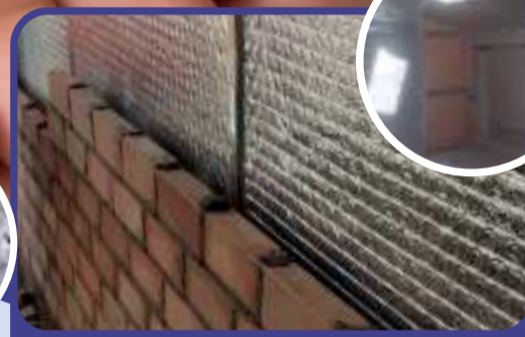
Paredes y trasdosados