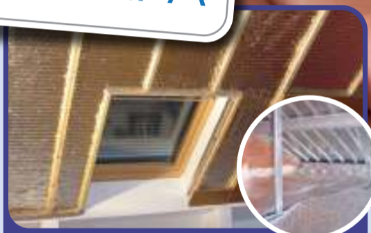
Techos y buhardillas