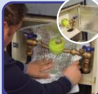
Contadores de agua y tapas de cuadros