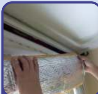
Cajones de persiana