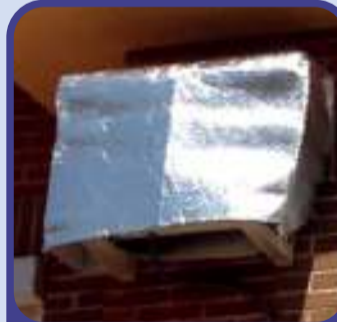
Equipos de climatización