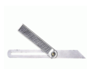
Escuadra ajustable MEDID de acero