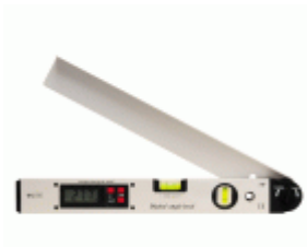
Escuadra goniómetro MEDID digital 400 mm