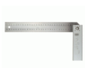
Escuadra graduable MEDID