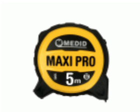
Flexómetro MEDID MAXI PRO