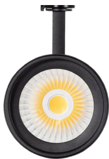
Detalle LED y óptica (negro)