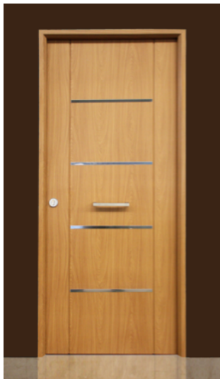
COMPOSICIÓN CHAPA + PVC