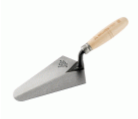
Paleta madreña con mango madera para trabajos de albañilería / 5842