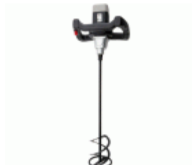
Máquina mezcladora M12LIGHT para realizar mezclas / M12LIGHT