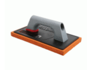
Talocha rectangular con esponja para fratasado de superficies / 5889