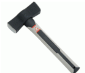
Maceta española con mango de fibra carbono para abrir rozas / 5308CF