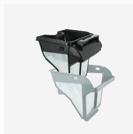
Filtro rectangular Filtro de doble nivel: 150/60 µ