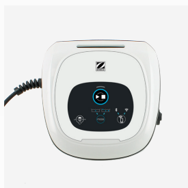
Unidad de control