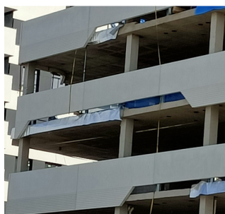
Cantos de forjado