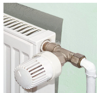
Radiadores y climatizadores