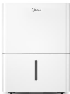
DN12 Capacité : 12L