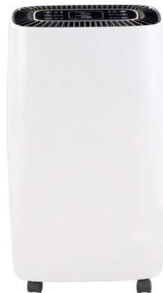
ODH-J04-100 Capacité : 10 ou 12L