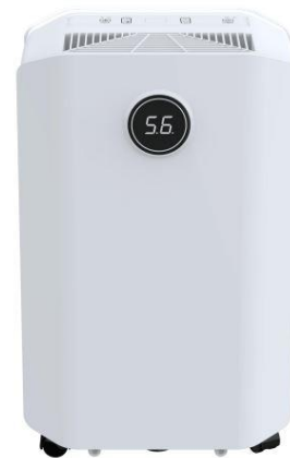
ODH-J05-200 Capacité : 20L