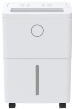
ODH-J03-060 Capacité : 6L