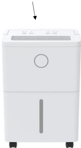
Design compact : 253 x 185 x 340 mm