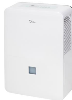
DM50 Capacité : 50L