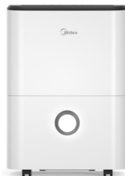
DF20 Capacité : 20L