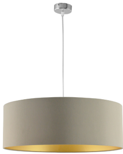
Colgante Topo Oro 752/50TOPO/OR