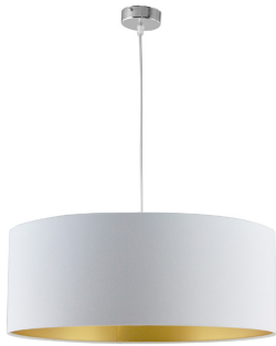
Colgante Blanco Oro 752/50BCO/OR