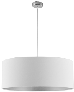
Colgante Blanco Gris 752/50BCO/GR