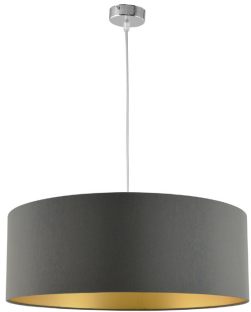
Colgante Marrón Oro 752/50MR/OR