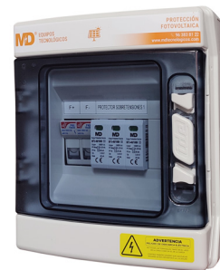
SPF 1/1-40/1000/16 (226)

Esta serie de protectores para sistemas fotovoltaicos tienen como finalidad proteger contra sobrecorrientes y sobretensiones producidas por impactos de rayos en la parte de continua de instalaciones generadoras de energía fotovoltaica.