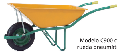
Modelo C900 con rueda neumática