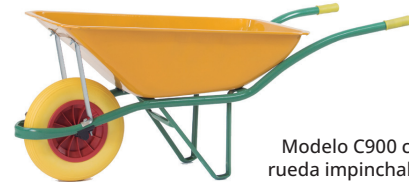
Modelo C900 con rueda impinchable