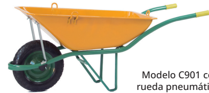
Modelo C901 con rueda neumática