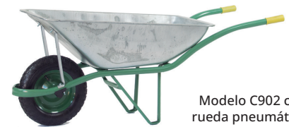
Modelo C902 con rueda neumática