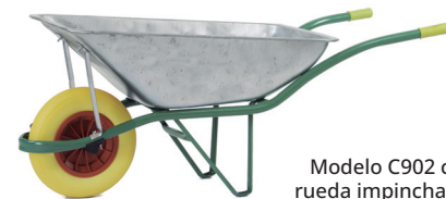
Modelo C902 con rueda impinchable