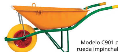
Modelo C901 con rueda impinchable