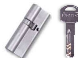
CILINDRO BASIC + 5 LLAVES