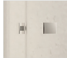
Handle / Tirador / Pega