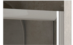
Profile / Perfil / Perfil