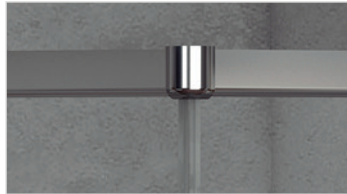
Angled joint profile / Perfil de unión en ángulo / Perfil de junta angular