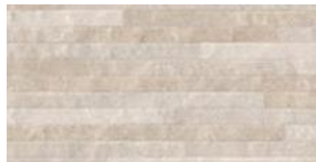
DC BEIGE LIGHT***