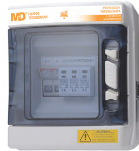
SPF 1/1-40/1000/20 (226)

Esta serie de protectores para sistemas fotovoltaicos tienen como finalidad proteger contra sobrecorrientes y sobretensiones producidas por impactos de rayos en la parte de continua de instalaciones generadoras de energía fotovoltaica.