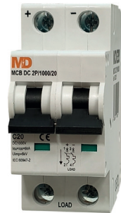
MCB DC 2P/1000/20