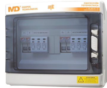
SPF 2/2-40/1000/20 (226)

Esta serie de protectores para sistemas fotovoltaicos tienen como finalidad proteger contra sobrecorrientes y sobretensiones producidas por impactos de rayos en la parte de continua de instalaciones generadoras de energía fotovoltaica.