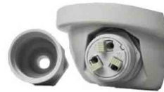
Detalle Conector In-Line IP68