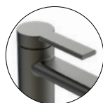
Gun metal / Gun metal / Gun metal