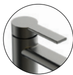
Gun metal / Gun metal / Gun metal