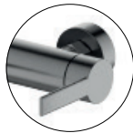
Gun metal / Gun metal / Gun metal