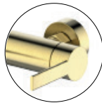
Brushed matt gold / Oro mate cepillado / Ouro escovado