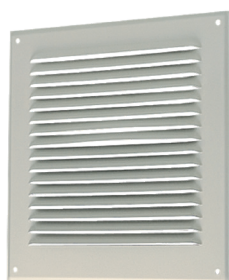
Grille métallique GAT

GAT-GR sont les grilles métalliques d'aération à destination des maisons individuelles et des logements collectifs.