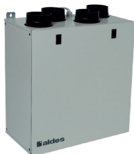
InspirAIR® Top 210

La VMC double flux la plus compacte du marché