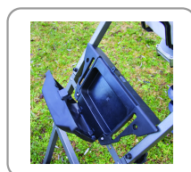
Boîtier de rangement des accessoires