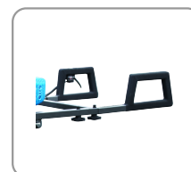
Poignées avec revêtement grip