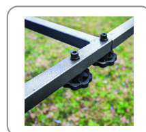
Châssis démontable sans outil