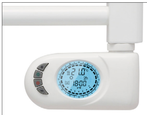
T700PE | T400PE | Detalle control TPE