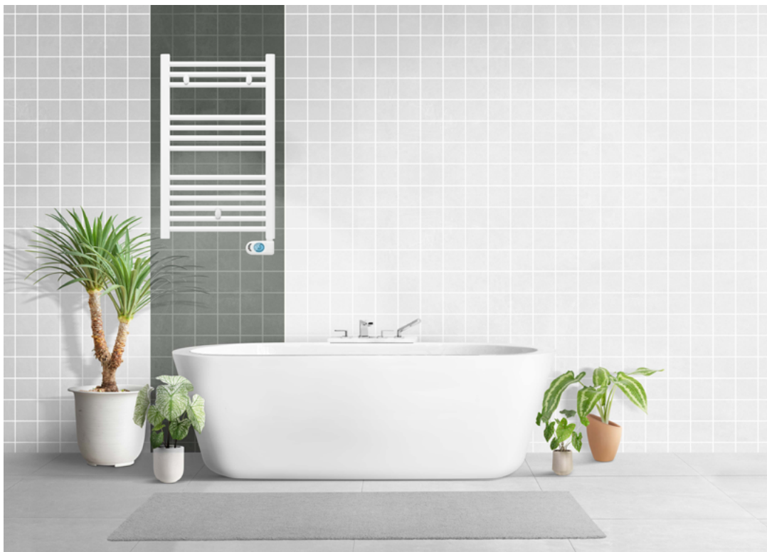
Modelo expuesto T400PE (879 x 500 mm) | Blanco recto

TOALLERO ELÉCTRICO FLUIDO CON CONTROL PROGRAMABLE